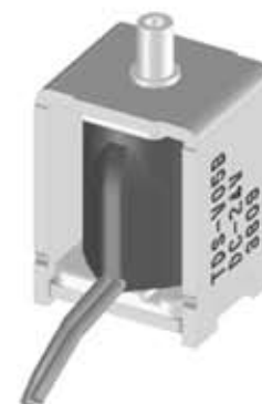
標準コイル表 連続定格 1.5W Standard Coil Specifications Cont. rating 1.5W